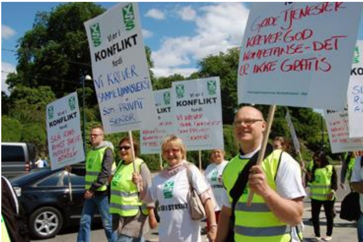
Bilde fra streiken 2012